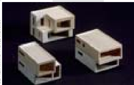
Albin Wimmer und Konrad Wisniewski