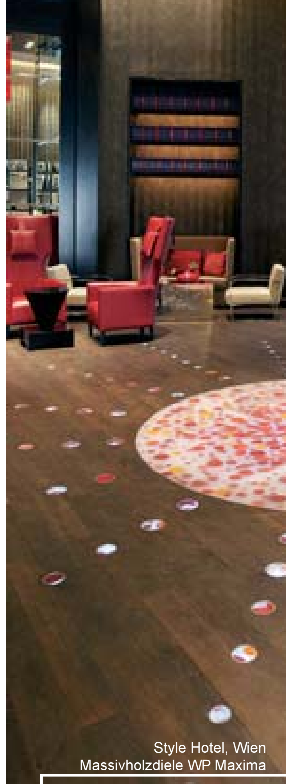
Style Hotel, Wien Massivholzdielen WP Maxima